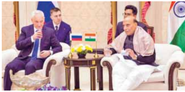
रूसी रक्षामंत्री आंद्रे बेलोसोव और रक्षा मंत्री राजनाथ सिंह।