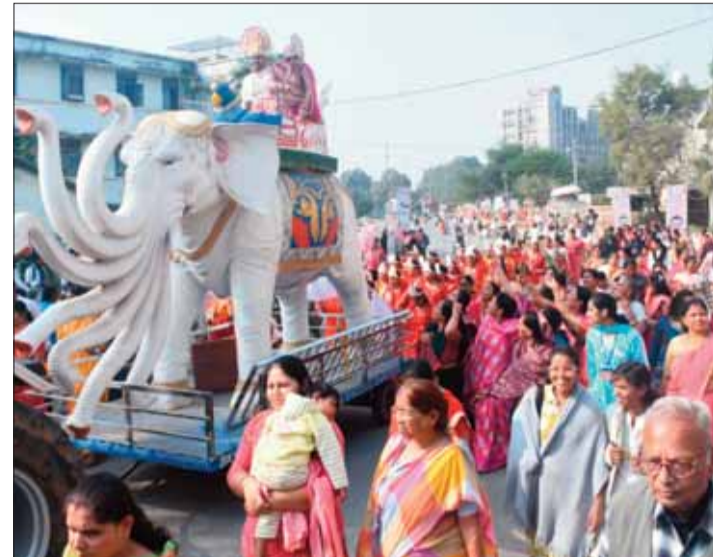
पांडुकशिला पहुंचकर सम्पन्न हुई, जहाँ 1008 कलशों से अभिषेक किया गया।