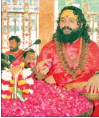
प्रतिदिन होंगे विधिवत अनुष्ठान

श्री बगलामुखी सिद्धपीठ शंकराचार्य मठ सिविक सेंटर मद्राताल में पौष मास के पावन आगमन पर सूर्योपासना महापर्व का शुभारंभ आज दिन शुक्रवार को पौष कृष्ण प्रतिपदा से हुआ। मासव्यापी यह आध्यात्मिक आयोजन 5 जनवरी 2026, पौष शुक्ल पूर्णिमा तक चलेगा। यह पूरा अनुष्ठान अनन्य श्रमिभूषित पूज्यपाद जगद्गुरु शंकराचार्य स्वामी स्वरूपानंद सरस्वती जी महाराज की कृपा परंपरा तथा द्वारकाशारदापीठाधीश्वर जगद्गुरु शंकराचार्य स्वामी सदानंद सरस्वती जी महाराज एवं ज्योतिष्पीठाधीश्वर जगद्गुरु शंकराचार्य स्वामी अविमुक्तेश्वरानंद सरस्वती जी महाराज के दिव्य आशीर्वाद से आयोजित हो रहा है।