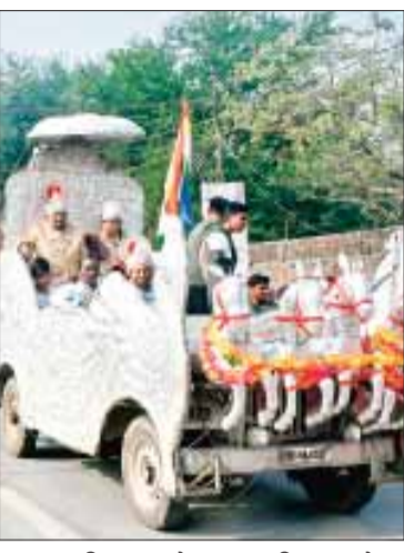
व्यक्त किया। जन्मोत्सव का पवित्र दृश्य देख श्रद्धालु भावविभोर हो उठे।