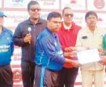
पहला मैच हरियाणा बनाम मध्य प्रदेश के बीच हुआ। मध्य प्रदेश ने पहले बल्लेबाजी करते हुए 20 ओवर में 137/9 रन बनाए, जिसे हरियाणा ने

जबलपुर। पंचदिवसीय राष्ट्रीय ब्लाइंड क्रिकेट नागेश ट्रॉफी का आज अंतिम दिन है, जिसमें सुपर-8 में स्थान बनाने के लिए मध्य प्रदेश, बिहार, हरियाणा और पांडिचेरी के बीच कड़ा संघर्ष होगा। उड़ीसा अपनी शानदार जीत के साथ पहले ही सुपर-8 में जगह बना चुकी है। प्रतियोगिता का समापन आज शाम 4 बजे होगा, जहां विजेताओं को सम्मानित किया जाएगा। चौथे दिन रानीताल क्रिकेट स्टेडियम में खेले गए मुकाबलों में